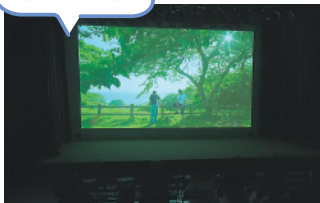
「うみのこえ」完成披露上映会