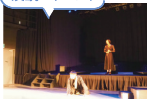
演劇社スナフ缶第3回公演