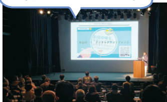
まちづくり・未来づくり講演会