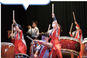
震災復興応援 和太鼓コンサート 2022